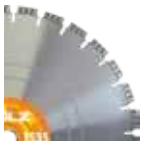
inkl. Diamant-trennscheibe TS35 Ø 350 mm