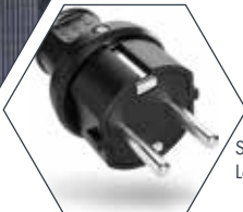
Schuko Ladekabel Ladezeit ca: 3 Std.